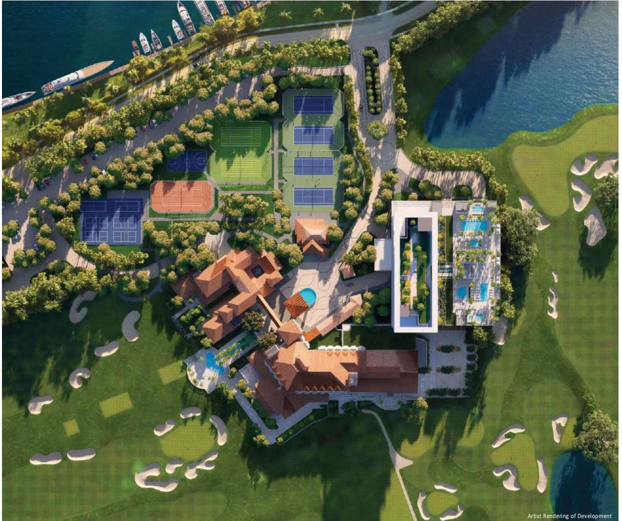
Artist Rendering of Development